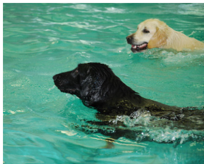
Vandhundene Lucy (flatcoated retriever) og Fenja (golden retriever) i svømmehallen. DE NYDER DET :o)

Svømmeture i kontrollerede omgivelser er fortrinligt til f.eks. konditionstræning, genoptræning efter skade eller motion som led i et slankeprogram. Bassinets rolige vand er også en formidabel ramme for hunde, der skal introduceres til vand og lære at svømme, eller hunde som er bange for vand.