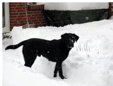
Simba (labrador retriever) i vinterens snedynger.

Der kommer også andre arrangementer i løbet af foråret og forsommeren – bl.a. en tur til hundesvømmehallen, et klikkursus og en sommerafslutning. Hold øje med hjemmesiden, som løbende opdateres med yderligere oplysninger om arrangementerne.