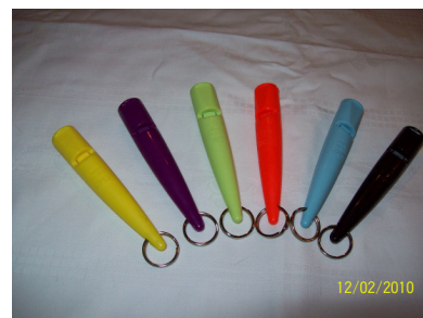
Der er en farve til enhver lejlighed :o) Kun 80 kr. pr. stk.