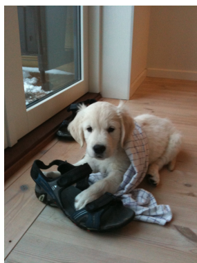
Carlo (golden retriever) er en af de seje på hvalp begynder.

Som sagt: Et nyt år er startet – og det er hundetræningen også. Efter juleferien har det været rigtig koldt og lidt drøjt at komme i gang p.g.a. al sneen, men selvom sneen stadig driller træningen både på træningspladsen og i skoven, så er vi nu i gang og må få det bedste ud af terrænet, som det nu engang er. Vi håber på snarlig tøj, så poterne igen kan mærke græs :o)