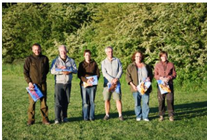
2. pladsen gik til Jagt begynder