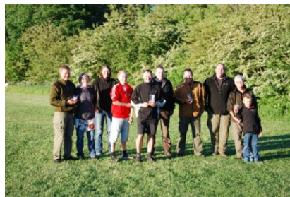
3. pladsen gik til Jagt øvet