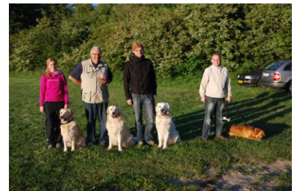
4. pladsen gik til Familieholdet

Der var naturligvis fine præmier til alle deltagende hunde. Tak til vores sponsor, Hundeogkattefoder.dk , som havde fundet hundefoder og dejlige hundehåndklæder frem – sidstnævnte kan jo nok bruges efter en kølende dukkert her i sommervarmen :o)