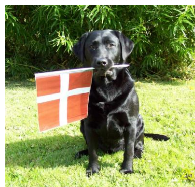
Aya ønsker tillykke med fødselsdagen :o)

Fredag d. 1. april kan Nordjysk Hundetræning fejre sin 2-års fødselsdag.