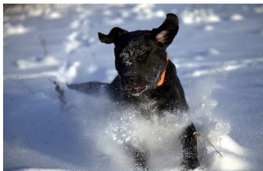
Brady (labrador retriever) i sneen.....eller er det en snescooter??? :o) Ejer og foto: Bjørn Nørgaard.