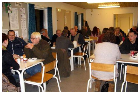
Klubhuset var fyldt til sidste stol ved generalforsamlingen d. 17. februar.....

I februar afholdt vi foreningens første ordinære generalforsamling. Også her var fremmødet flot..... især efter gentagne "indbydelser" pr. mail :o) Referat fra mødet er lagt ud på hjemmesiden.