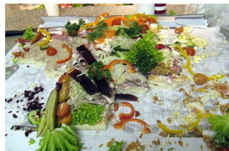
..... men det lykkedes nu alligevel ikke deltagerne at "spise os ud af huset" :o)