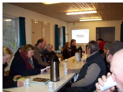
Projektoren bruges til bl.a. introduktionsmøde for "hvalp begynder".

December bragte dejlige julegaver til klubhuset. TUBORG-FONDET meddelte, at vores ansøgning om en projektor samt to stk. borde-/bænkesæt kunne imødekommes. Projektoren bliver allerede flittigt brugt af flere klubber, og borde-/bænkesættene er stillet op, men p.g.a. vintertemperaturene er de dog først nu ved at finde fuld anvendelse. Det er dejligt at modtage sådanne tilskud, når man ønsker sig større ting :o)