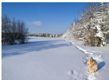
Xantos (golden retriever) i dynger af sne. Smukt er det da :o)

Mail og mobiltelefon er praktiske redskaber, når vi skal i kontakt med vores medlemmer / kursister, men det kræver, at vi har korrekt mailadresse og mobilnummer stående i kartoteket. HUSK derfor at meddele evt. ændringer til Tina på mail: tina-flemming@vip.cybercity.dk , hvis du gerne vil høre fra os!