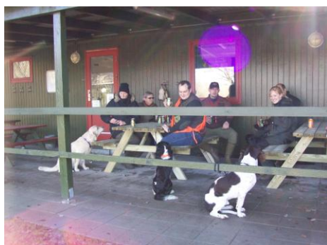
Borde-/bænkesættene er flyttet ind på terrassen. Her er det Jagt Intro, der slukker tørsten efter en hård træning :o)

December bragte dejlige julegaver til klubhuset. TUBORG-FONDET meddelte, at vores ansøgning om en projektor samt to stk. borde-/bænkesæt kunne imødekommes. Projektoren bliver allerede flittigt brugt af flere klubber, og borde-/bænkesættene er stillet op, men p.g.a. vintertemperaturene er de dog først nu ved at finde fuld anvendelse. Det er dejligt at modtage sådanne tilskud, når man ønsker sig større ting :o)